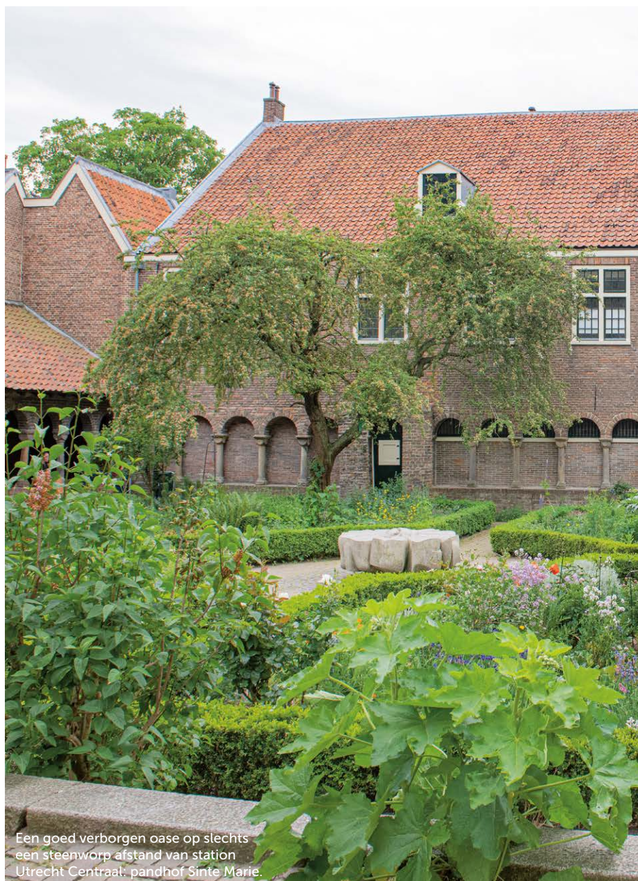
Een goed verborgen oase op slechts een steenworp afstand van station Utrecht Centraal: pandhof Sinte Marie.

Lunetten is al lekker schoon, maar eenmaal buiten de wijk is er meer werk aan de winkel. Plekken als winkelcentra (zoals het Smaragdplein) en het voormalig industrieterrein Rotsoord zijn altijd dankbare plandelplekken. Vooral Rotsoord ontpopt zich tot culturele hotspot met duurzaamheid hoog in het vaandel. In de oude Pastoe-meubelfabriek wordt nu een nieuwe generatie kunstenaars en designers klaargestoomd, terwijl in de majestueuze oude watertoren tegenwoordig een restaurant huist. Wel met een wachtlijst van hier tot Tokio, maar ook een uitzicht dat alleen overtroffen wordt door het uitzicht vanaf de Domtoren. Veel activiteit is te vinden bij houtwerkplaats Tafelboom (Rotsoord 32). Hier krijgen gerooide Utrechtse stadsbomen een tweede leven, bijvoorbeeld in de bankjes die je overal in het gebied vindt en die door buurtbewoners en de lokale ondernemers zelf zijn gecrowdfund. In het verlengde van het hippe Rotsoord ligt de Westerkade. In een voormalige drukkerij wordt nu Werfzeep gemaakt en in het standje van Koffie Leute verkocht. Zonder palmolie of plastic en verkrijgbaar in prikkelende varianten, zoals 'chocolade'. Verkocht! Bij de buurvrouw, die de speelgoed- en knutselwinkel runt, kun je een mooi cadeau voor jonge plandelaars scoren: afvalgrijpers op kinderformaat. Tijdens onze wandeling oogsten we niet alleen zwerfafval, maar ook opgestoken duimen en kreten als 'goed bezig!'.