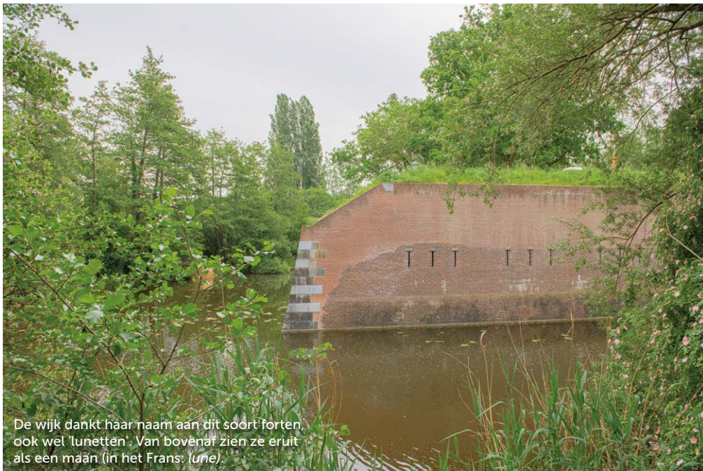
De wijk dankt haar naam aan dit soort forten, ook wel 'lunetten'. Van bovenaf zien ze eruit als een maan (in het Frans: lune ).

"Leave nothing behind, except footsteps"