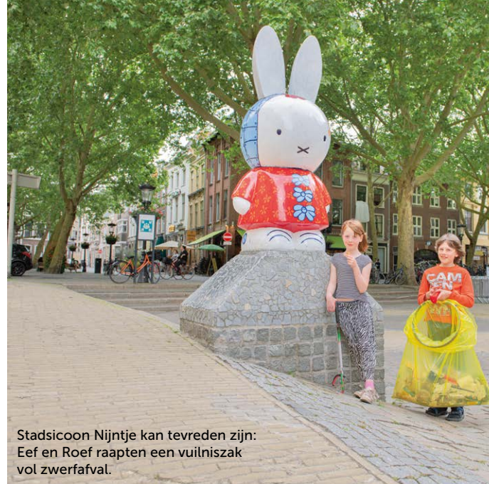
Stadsicoon Nijntje kan tevreden zijn: Eef en Roef raapten een vuilniszak vol zwerfafval.